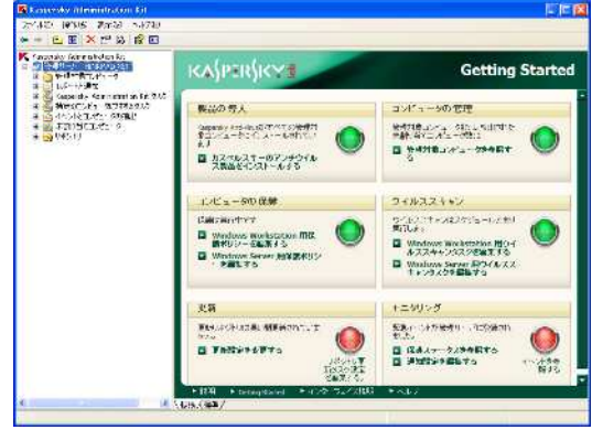
Administration Kit のトップメニュー