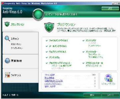
Anti-Virus for Windows Workstation のトップメニュー